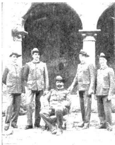
El general boer Fienaar y sus cuatro hijos, residentes en territorio portugués, que esperan la liquidación de sus bienes en el Transvaal para emigrar a la Argentina.

nuestras nacientes poblaciones como el doctor Rudolph Krieger, abnegado facultativo y patriota meritorio que ha preferido abandonar para siempre sus campos nativos a prestar juramento de fidelidad a los vencedores. Públicamente recomendado por su bravura en los primeros meses de la guerra, en Spionkop y Statrand, el doctor Krieger obtuvo más tarde ser nombrado comandante de un escuadrón de exploradores, distinguiéndose entre todos en Dalmanutha el 19 de Agosto de 1900, contra las fuerzas del general Butler. Y desde entonces, como cirujano unas veces y como soldado otras, su acción fué siempre brillante hasta Enero de 1902 en que fué hecho prisionero, destinándose al campo reconcentrado de Umbili, Natal, a pesar de adelantarse con bandera blanca a pedir medicamentos por mandato del general Botha.