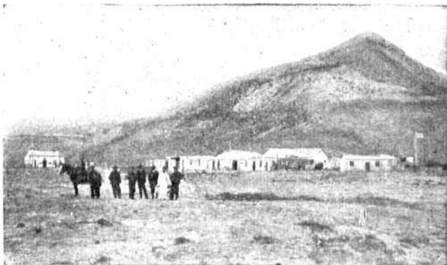
PUEBLO COMODORO RIVADAVIA EN EL TERRITORIO DEL CHUBUT CON EL «PICO DE LOS INDIOS», DONDE SE HA FUNDADO LA COLONIA BOER