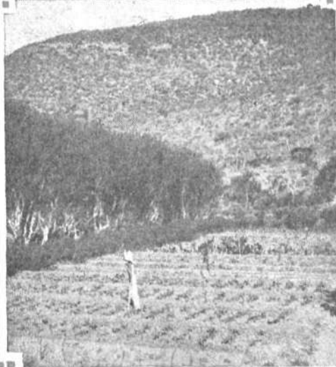
Plantas de tamarisco, en Manantial Rosales, para reparo de cultivos de huerta.

tituye un reparo muy eficaz para las quintas frutales.