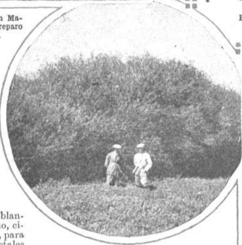
Una vigorosa plantación de mimbre; es también un reparo eficaz.