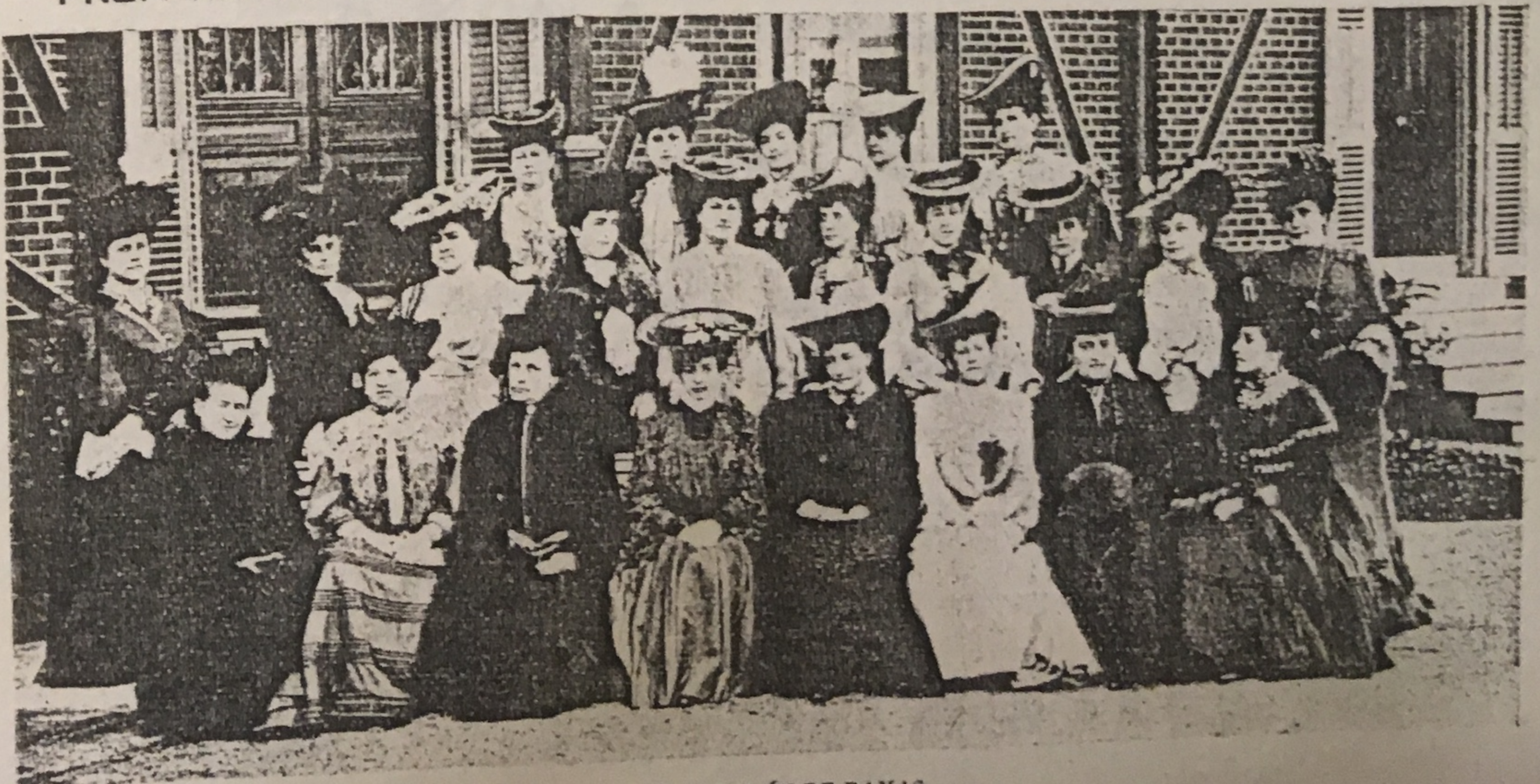
LA COMISIÓN DE DAMAS