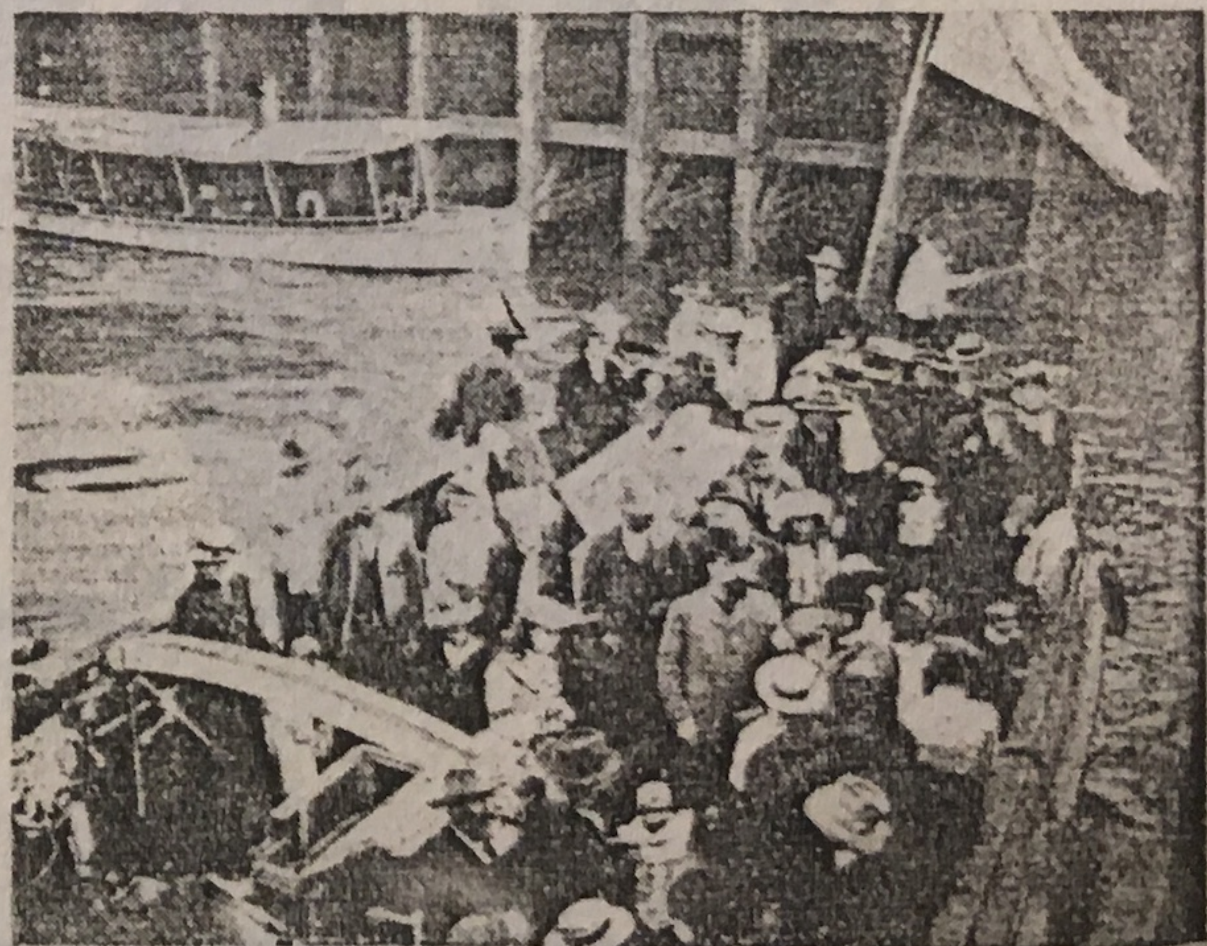
3 ENTONANDO UNA ACCIÓN DE GRACIAS POR EL FELIZ ARRIBO Á LA ARGENTINA