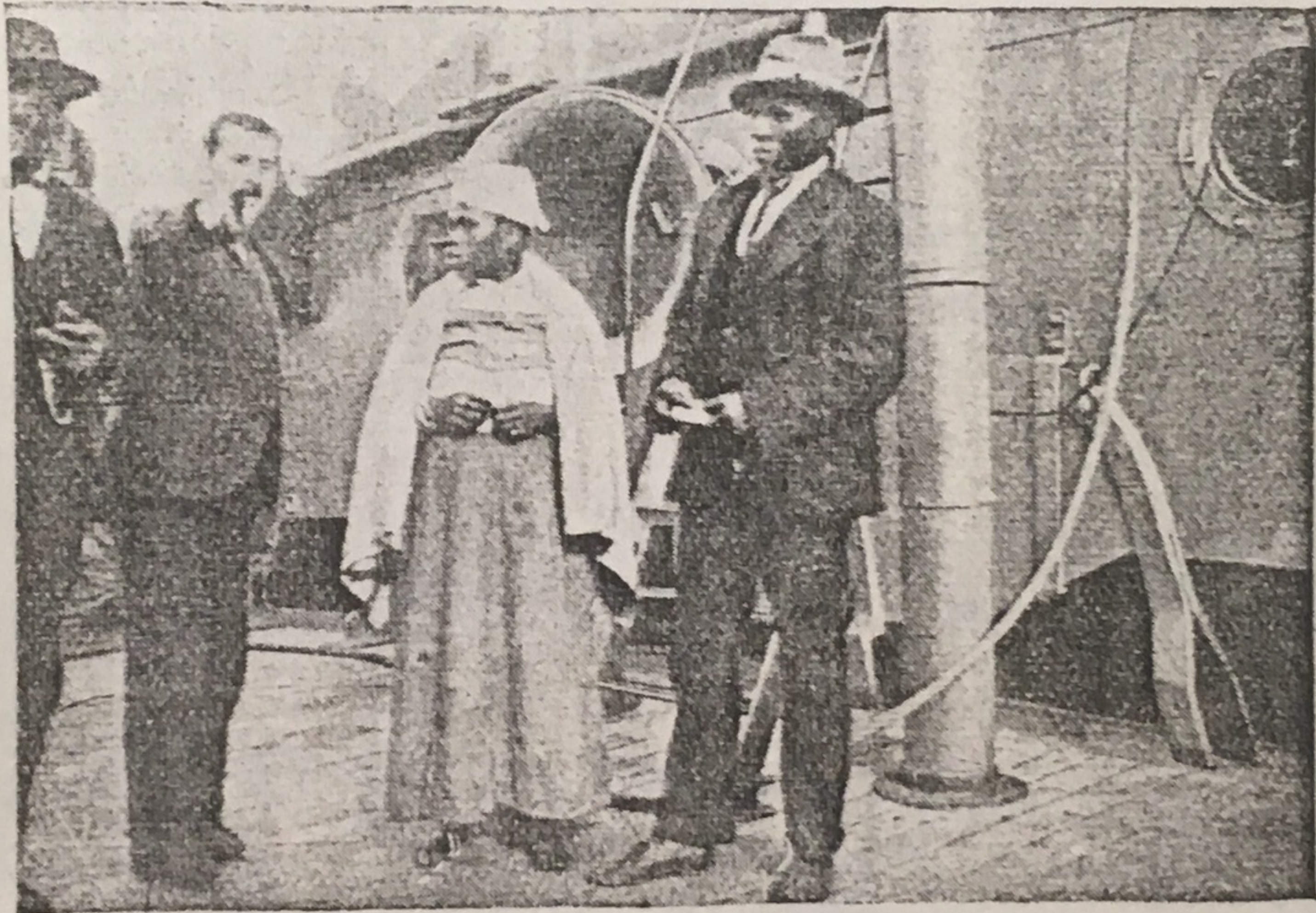
MATRIMONIO DE CAFRES INMIGRANTES

sana, jovial, y de trabajo, de aspecto simpático y sencillo, con esa sencillez característica de los pueblos primitivos que vivieron en comunión inmediata con la naturaleza. Los niños, de los que viene un gran número, son verdaderamente encantadores. Casi todos visten á la usanza de su país, que es de un riguroso corte escocés. Las jóvenes son, como los hombres, robustas, bien formadas y de rostro agradable y simpático. No usan corsé. Hablan inglés, pero con marcado acento colonial, es decir, pronunciándolo ruda é imperfectamente.