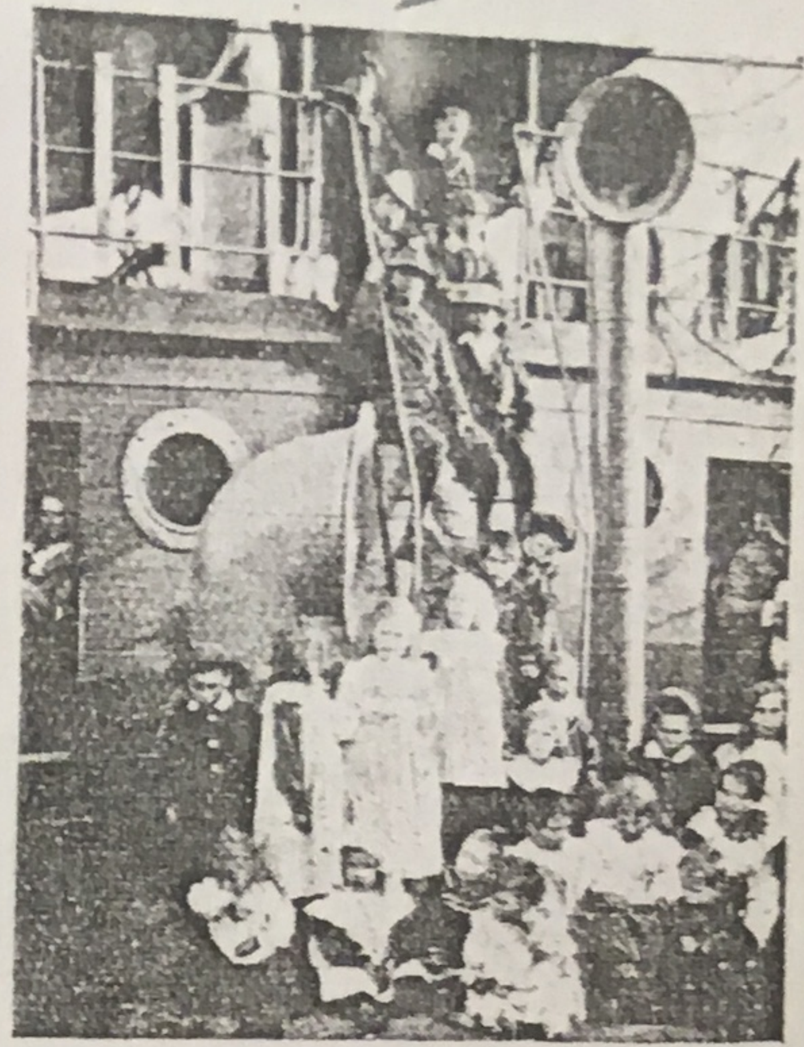
NIÑOS BOERS, Á BORDO DEL «GUARDIA NACIONAL»

mando guerrillas insurrectas que cooperaron en mucho á la prolongación de la guerra. Son gente vigorosa,